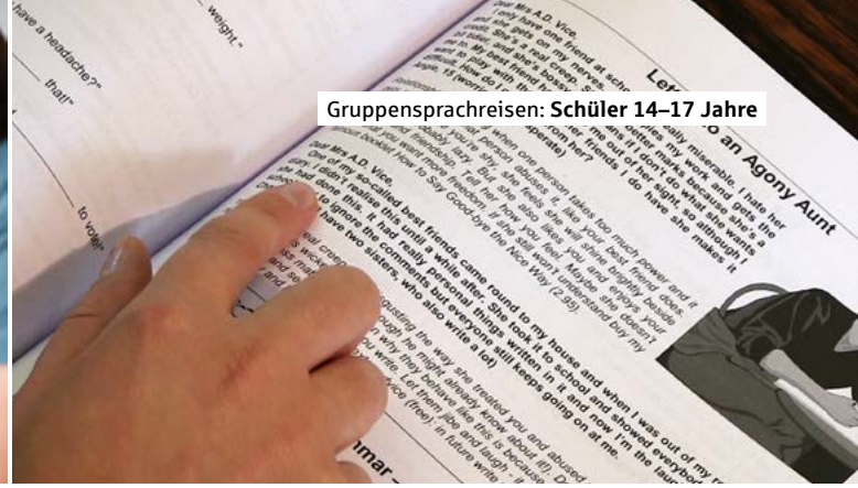
Gruppensprachreisen: Schüler 14–17 Jahre